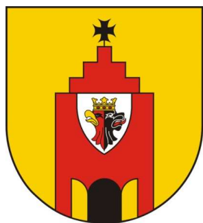
Herb gminy Radziejów

Przez teren gminy przebiegają również szlaki turystyczne. Szlak Łokietka wiedzie z Inowrocławia przez Kruszwicę, Radziejów, Płowce do Kowala, Szlak Powstania Styczniowego na Kujawach prowadzi z Aleksandrowa Kujawskiego przez Dobre, Radziejów, Piotrków Kujawski, Babiak, Izbicę, Brześć Kujawski do Włocławka. Lokalnym szlakiem turystycznym jest Szlak bitwy pod Płowcami wiodący z Radziejowa przez Pruchnowo, Stary Radziejów, Płowce, Witowo do Osiecin.