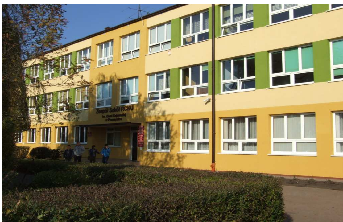
Zespół Szkół Centrum Kształcenia Ustawicznego im. Ziemi Kujawskiej w Przemystce