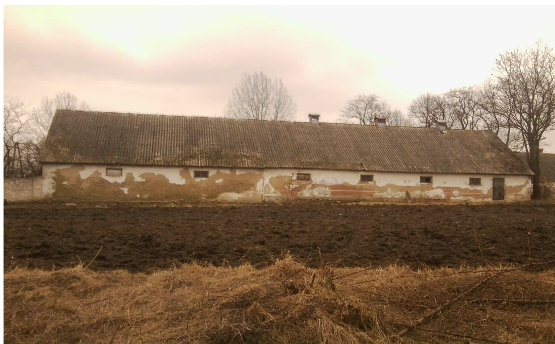
dworska stajnia koni z okresu przedwojennego