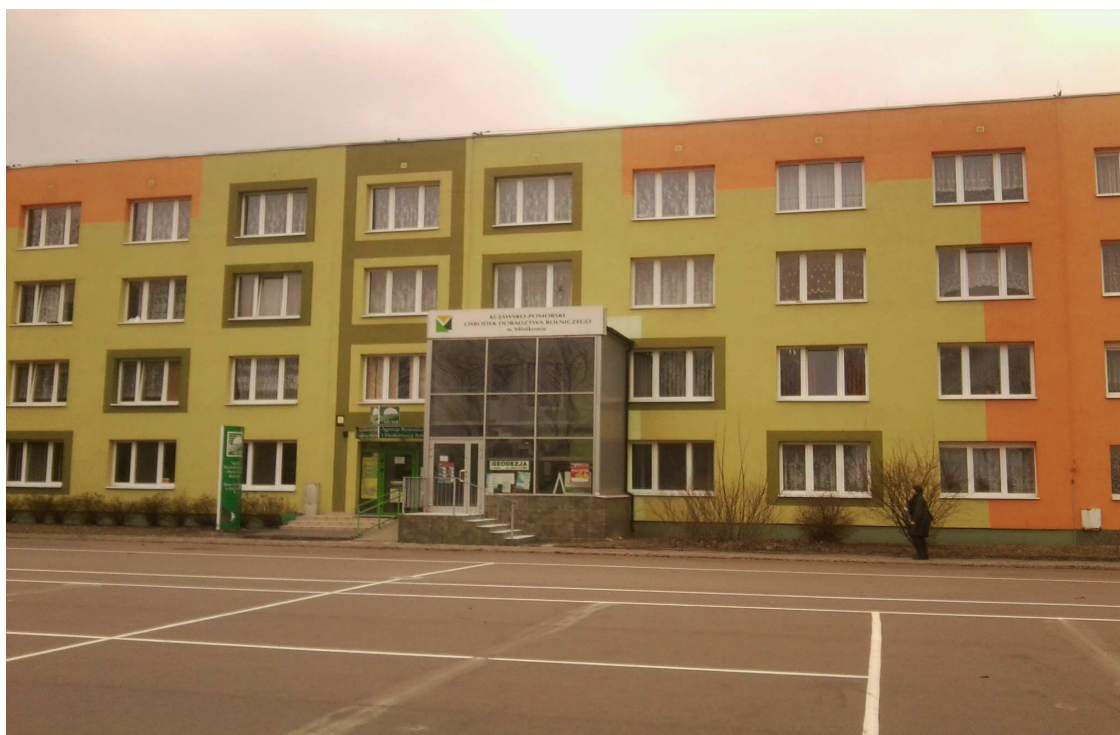
Internat szkoły, w którym m.in.