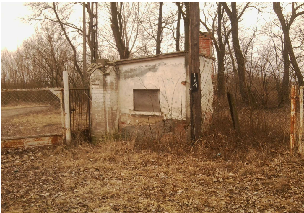
stróżówka z 1933 roku