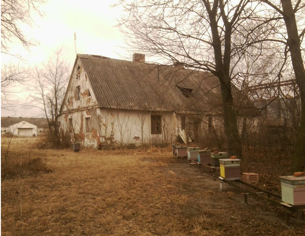
dawny dworek z 1923 roku