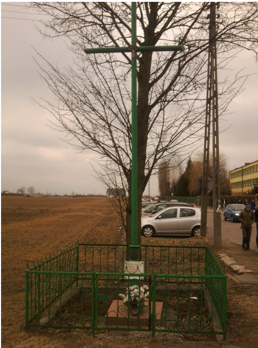
przydrożny krzyż z okresu międzywojennego