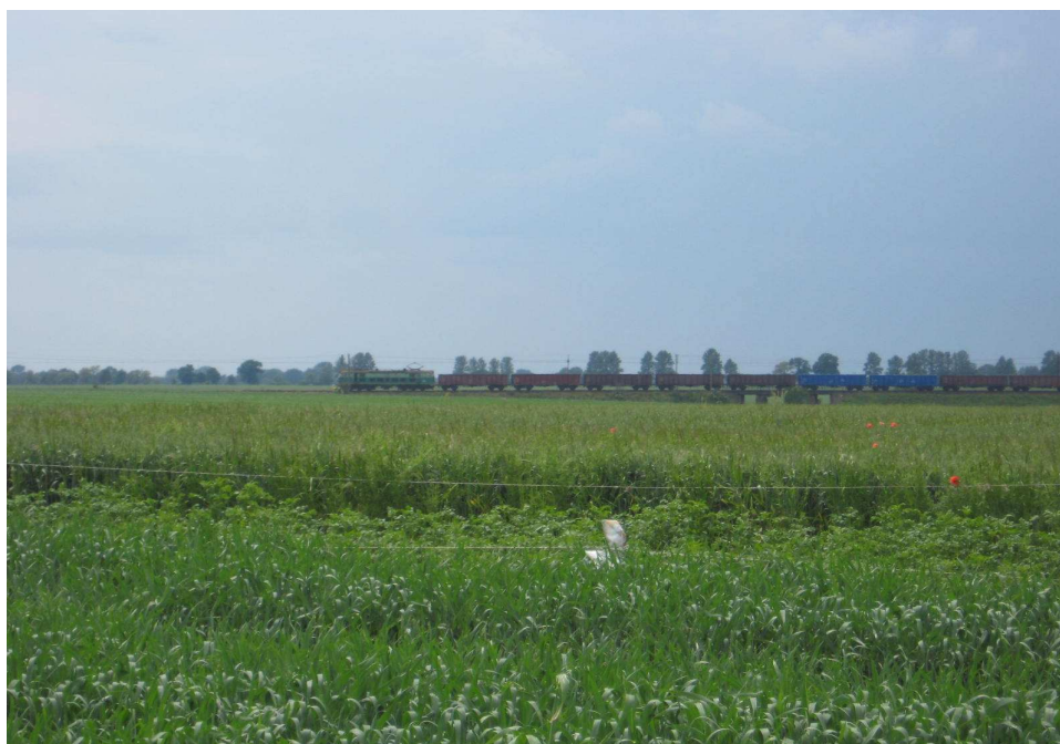
Widok na linię kolejową przechodzącą nieopodal Płówek