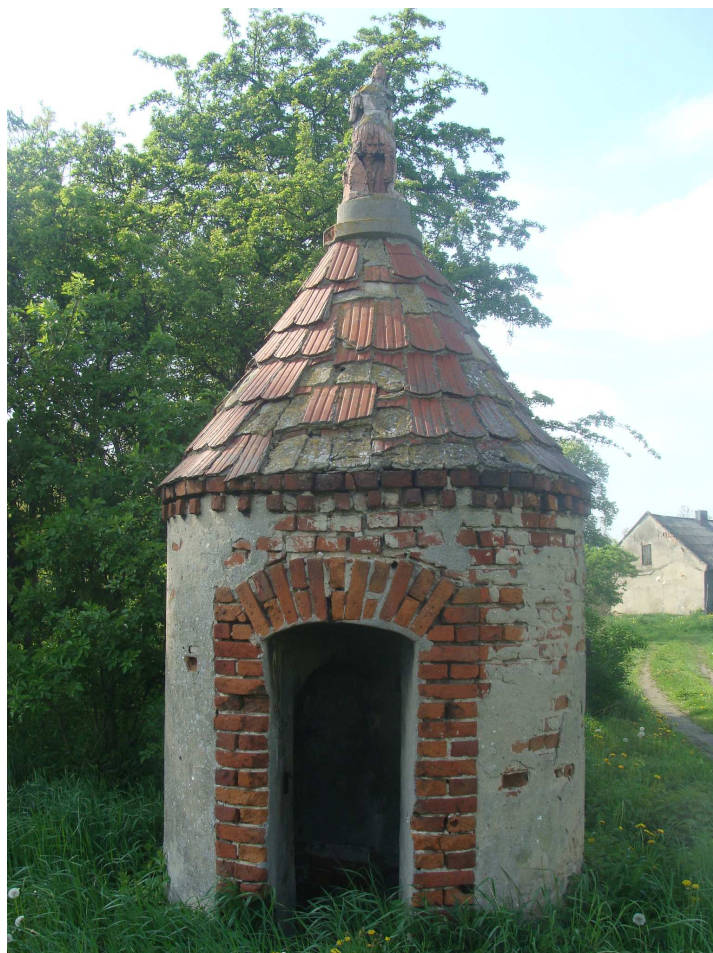
Element dawnej bramy wjazdowej do majątku w Broniewku