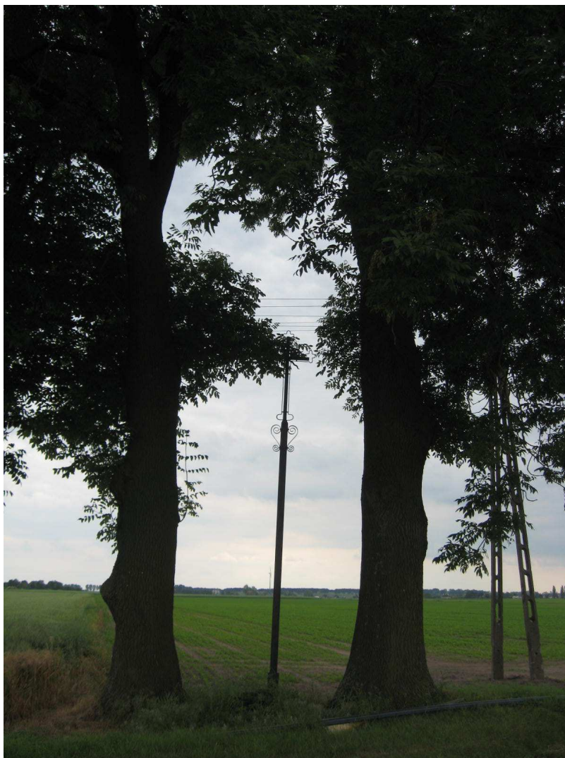
Przydrożny krzyż w Płowkach