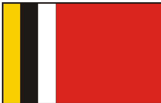
Flaga Gminy Radziejów