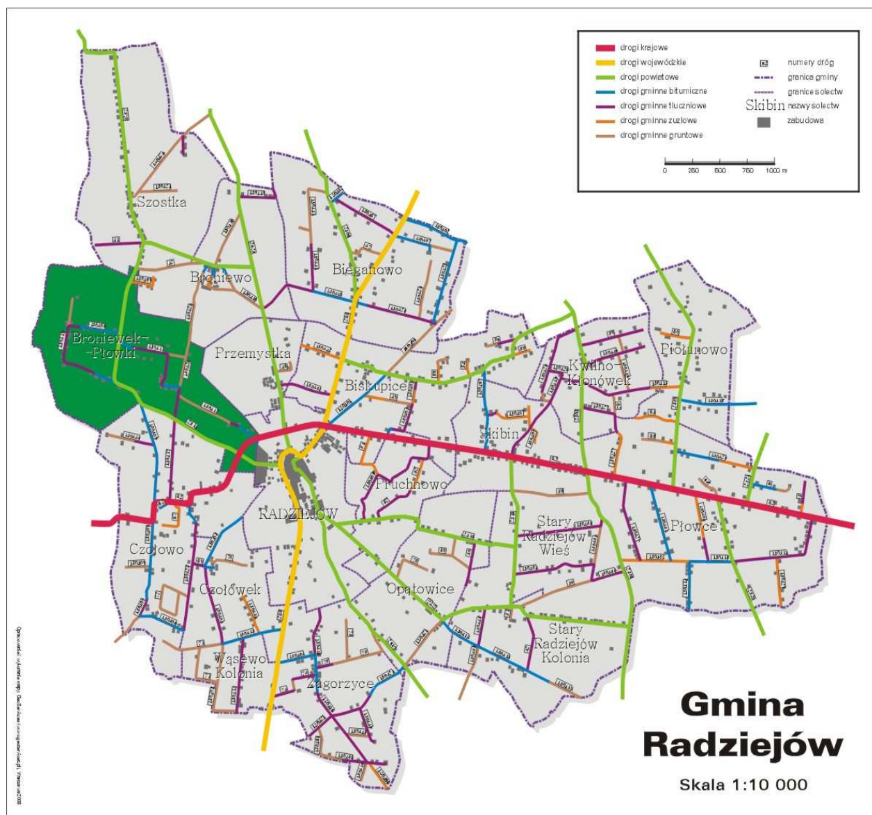
Mapa obrazująca Gminę Radziejów z zaznaczonym położeniem Broniewka i Płówek (materiały Urzędu Gminy w Radziejowie)

Miejscowości Broniewek oraz Płowki leżą w województwie kujawsko-pomorskim, w powiecie radziejowskim, na terenie gminy Radziejów. Miejscowości te tworzą jedno sołectwo. Płowki leżą na pograniczu dwóch powiatów – radziejowskiego i inowrocławskiego. Graniczą z miejscowościami: Szostka, Broniewek, Morgi, Chełmce i Głębokie. Przez środek wsi przebiega kanał, który ma ujście w jeziorze Gopie. Broniewek. Wieś jest oddalona o około 5 km na północny – zachód od Radziejowa. Broniewek jest oddalony od Radziejowa o około 4 km.