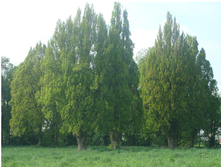
Park w Broniewku