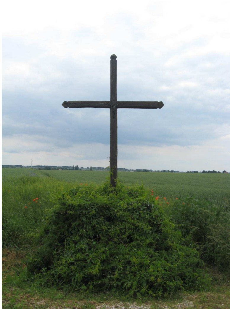
Drewniany krzyż przydrożny w Pławkach