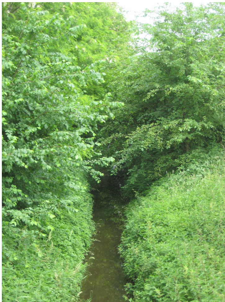
Kanał przepływający przez Płowki