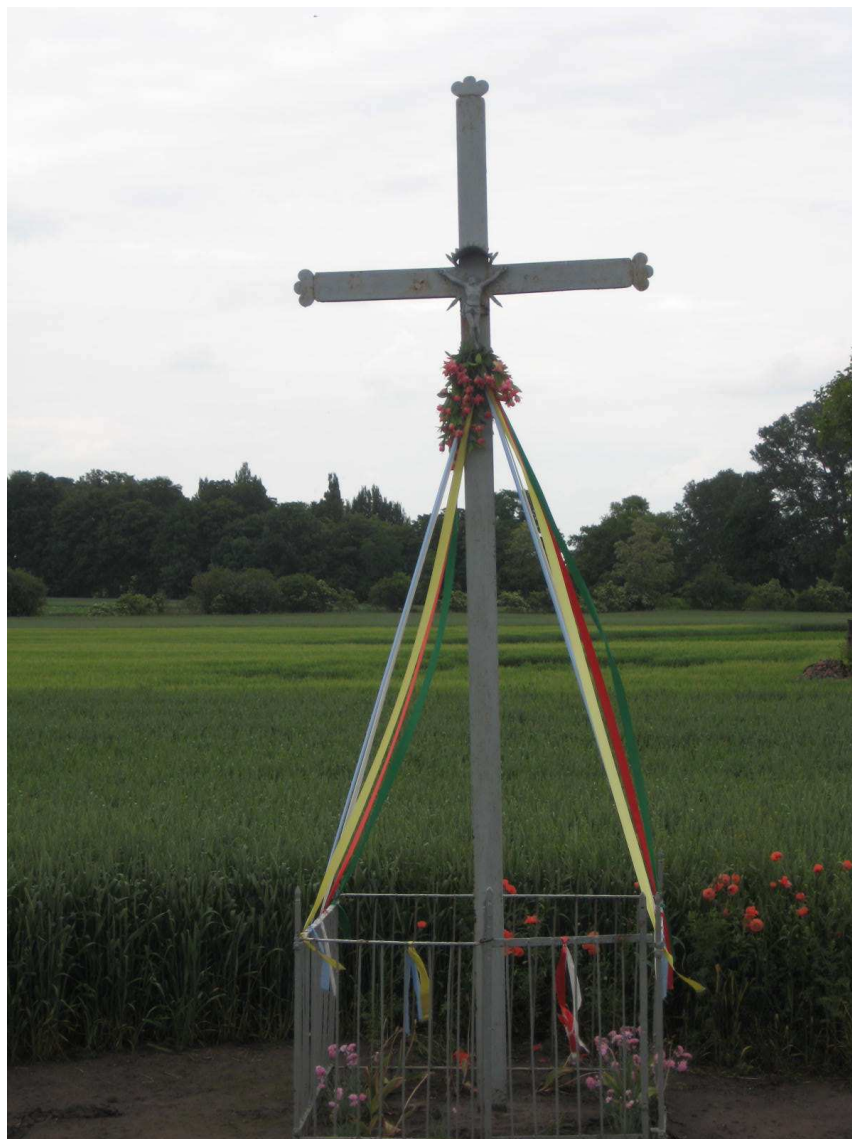
Przydrożny krzyż w Płowkach