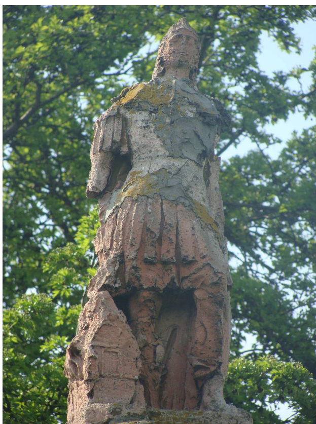
Figura św. Floriana w Broniewku